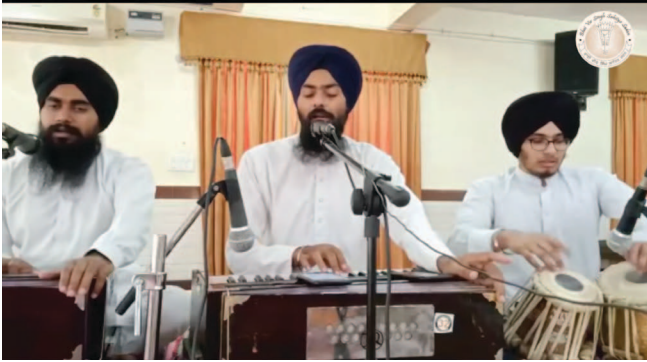
ਗੁਰੂ ਗ੍ਰੰਥ ਸਾਹਿਬ ਵਿੱਦਿਆ ਕੇਂਦਰ ਦੇ ਵਿਦਿਆਰਥੀ ਅਕਾਲੀ ਬਾਣੀ ਦਾ ਮਨੋਹਰ ਕੀਰਤਨ ਕਰਦੇ ਹੋਏ।